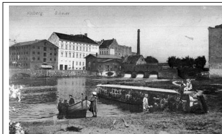
Widok Batardeau od zachodu przed 1945 r.

Ochrona w zakresie pełnego zachowania istniejących relikwów obiektu