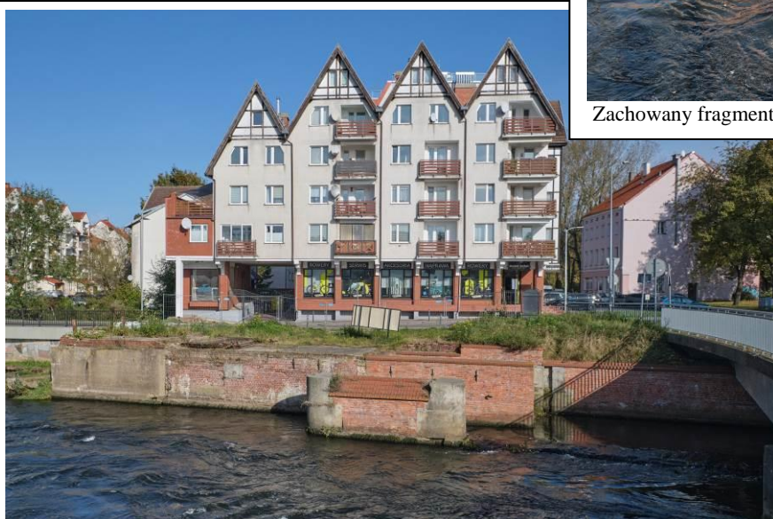
Relikt przyczółka i jednego filara Batardeau w Kołobrzegu