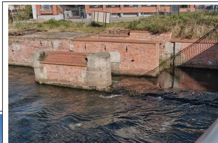
Zachowany fragment filaru Batardeau w Kołobrzegu

7. Fotografia z opisem wskazującym orientację albo mapa z zaznaczonym stanowiskiem archeologicznym