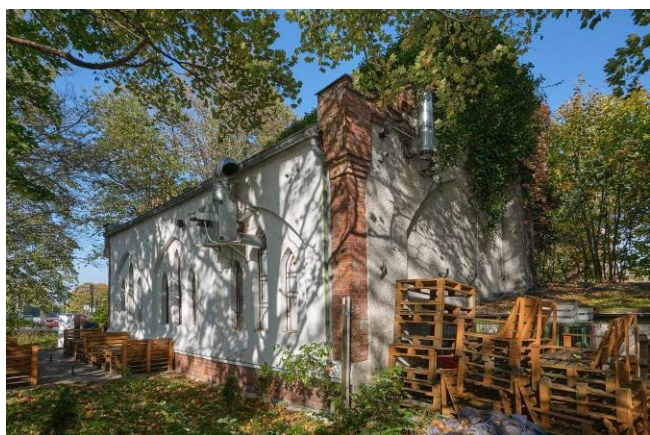
Widok ogólny bryły od strony południowej