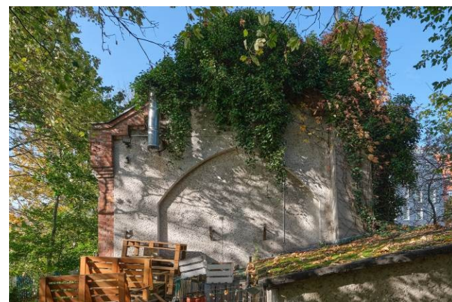
Widok ogólny bryły od strony południowo-wschodniej