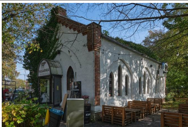
Widok bryły od strony zachodniej

7. Fotografia z opisem wskazującym orientację albo mapa z zaznaczonym stanowiskiem archeologicznym