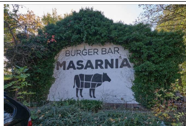
Widok ogólny od strony północno-wschodniej