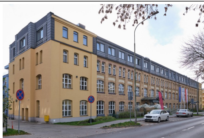
Widok ogólny bryły od strony północno-wschodniej

7. Fotografia z opisem wskazującym orientację albo mapa z zaznaczonym stanowiskiem archeologicznym