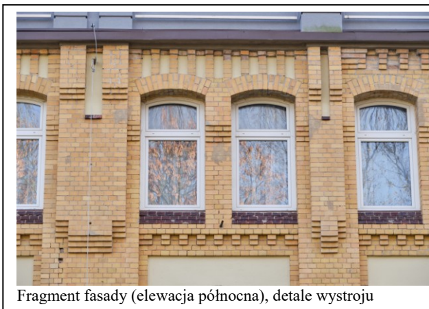
Fragment fasady (elewacja północna), detale wystroju