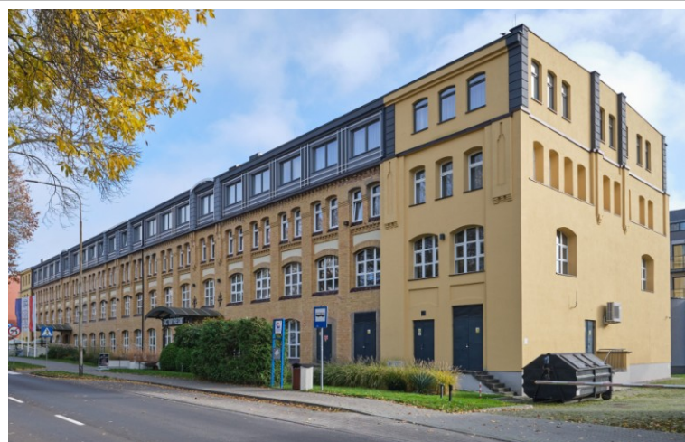
Widok ogólny bryły od strony północno-zachodniej