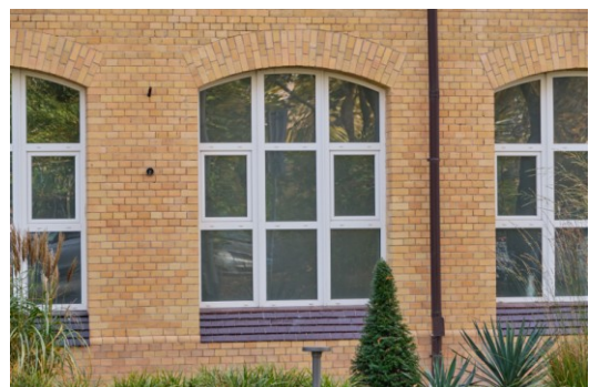
Fragment fasady, przykładowe okno