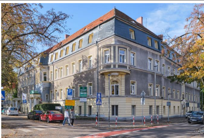
Widok ogólnej bryły od strony północno-wschodniej

7. Fotografia z opisem wskazującym orientację albo mapa z zaznaczonym stanowiskiem archeologicznym