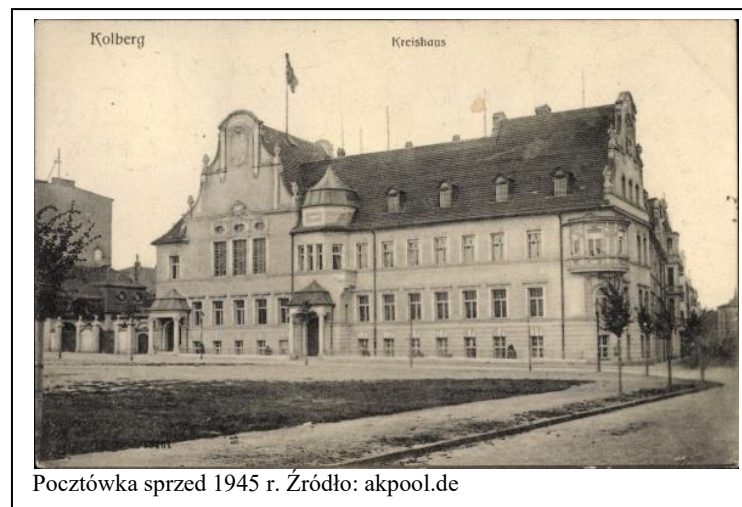
Pocztówka sprzed 1945 r.

- wszelkie prace budowlano-konserwatorskie winny być uzgadniane z MKZ w Kołobrzegu. Obowiązuje zachowanie: historycznej bryły, kompozycji i podziałów elewacji frontowej wraz z detalami wystroju architektonicznego, oryginalnych stolarek (okiennych, drzwiowych, balustrad schodów); w przypadku zniszczenia historycznej formy, przy wymianie wskazane jest odtworzenie pierwotnego kształtu i podziałów.