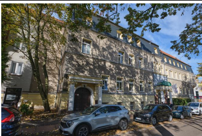
Widok na fasadę wschodnią od strony ul. Katedralnej