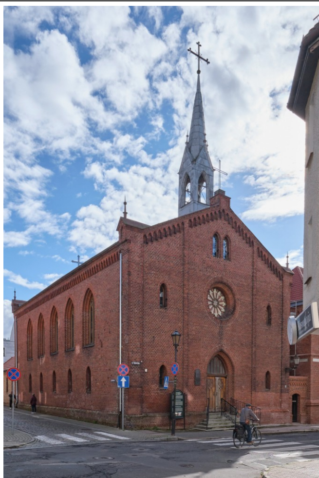
Widok ogólny bryły od północnego zachodu

7. Fotografia z opisem wskazującym orientację albo mapa z zaznaczonym stanowiskiem archeologicznym