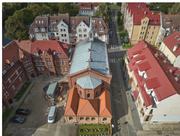
Widok ogólny z lotu ptaka od strony wschodniej