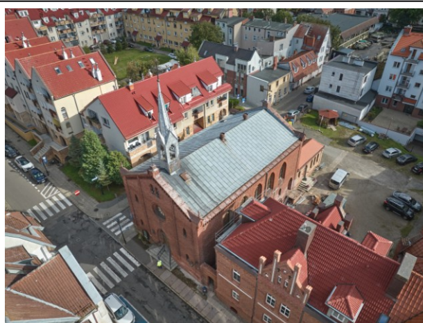
Widok ogólny z lotu ptaka od południowego zachodu