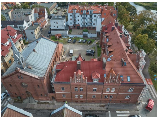
Widok ogólny założenia z lotu ptaka od zachodu

7. Fotografia z opisem wskazującym orientację albo mapa z zaznaczonym stanowiskiem archeologicznym