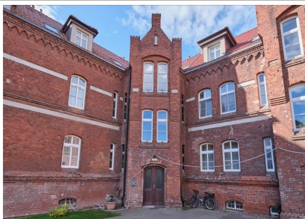
Fragm. elewacji dziedzińcowej z narożnym ryzalitem