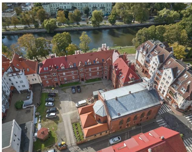
Widok ogólny założenia z lotu ptaka od północnego wschodu