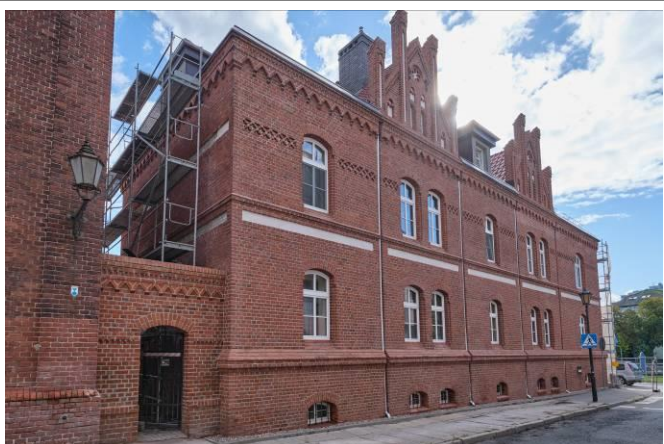
Widok elewacji skrzydła zachodniego, od strony ul. Katedralnej