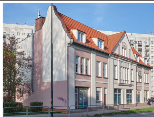
Widok ogólny od pñd.-wschodu