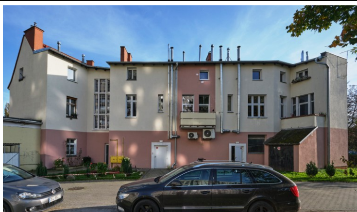
Elewacja tylna (północna)