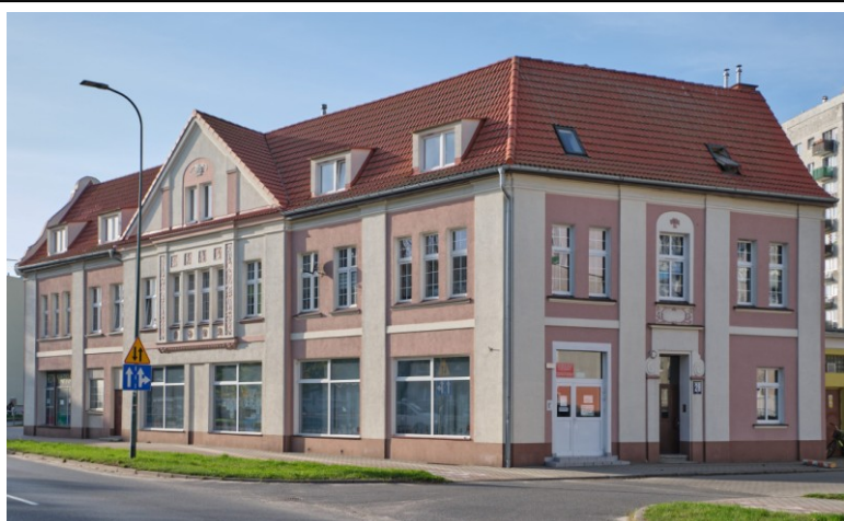
Widok ogólny od pñ.-wschodu

7. Fotografia z opisem wskazującym orientację albo mapa z zaznaczonym stanowiskiem archeologicznym