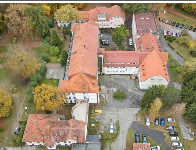
Widok ogólny od wschodu