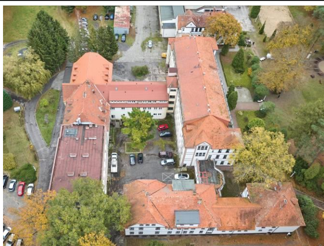
Widok ogólny od zachodu