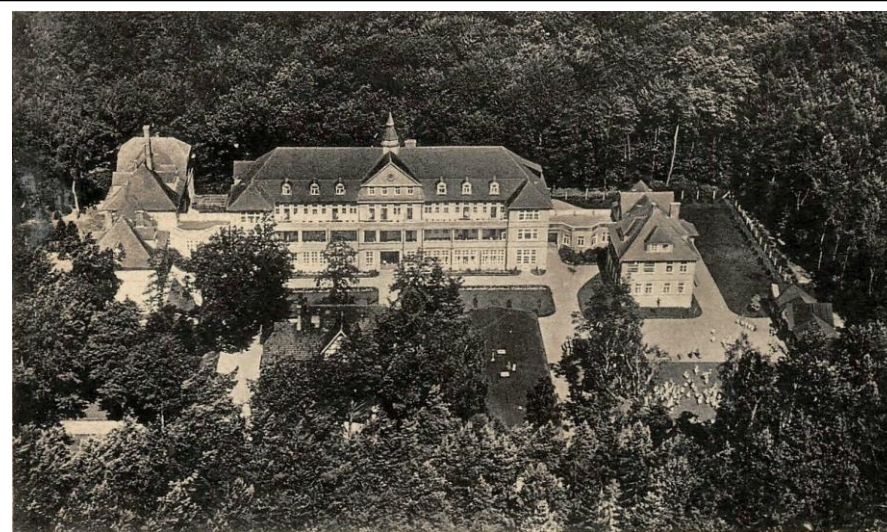
Zespół szpitalny - widok ok. 1935 r. www.fotopolska.eu