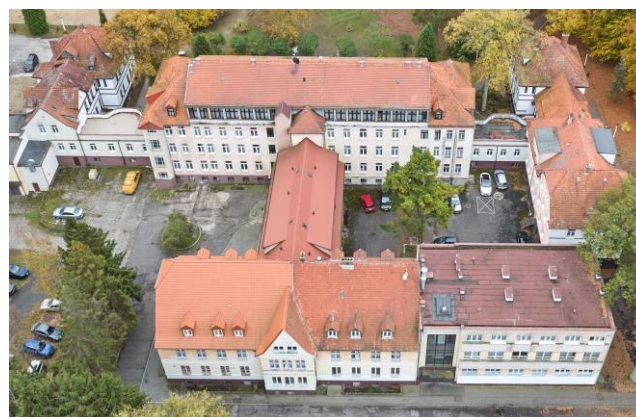
Widok ogólny od północy