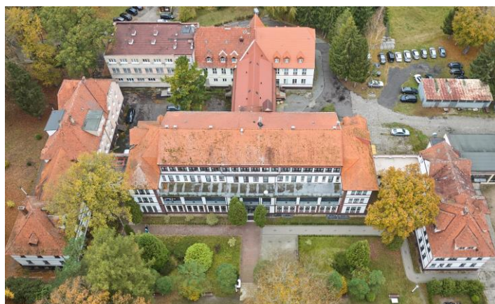
Widok ogólny od południa

7. Fotografia z opisem wskazującym orientację albo mapa z zaznaczonym stanowiskiem archeologicznym