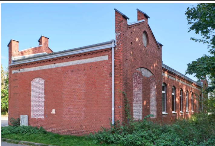
Widok ogólny od zachodu