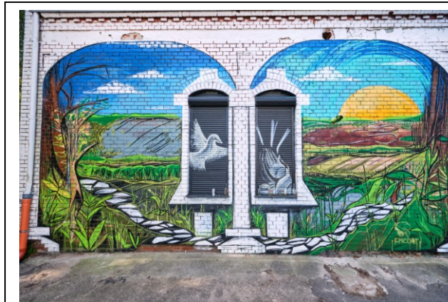
Elewacja południowa z murałem