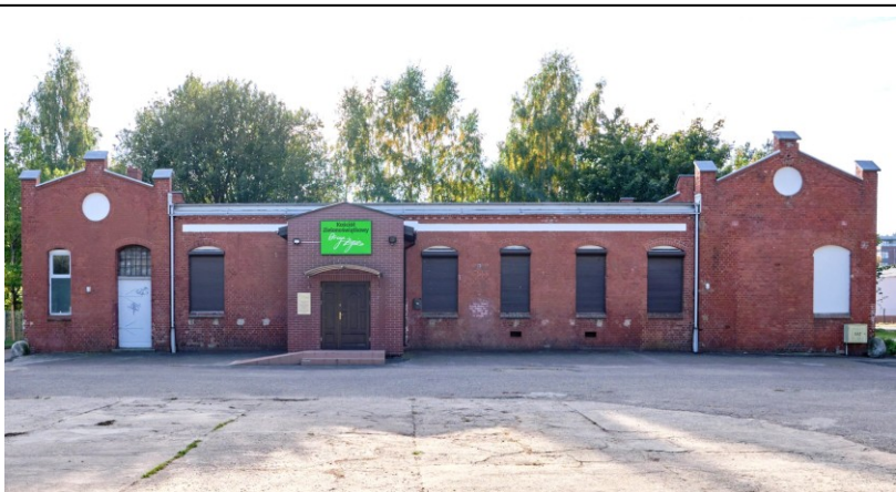
Elewacja frontowa (płn.-wschodnia)

7. Fotografia z opisem wskazującym orientację albo mapa z zaznaczonym stanowiskiem archeologicznym