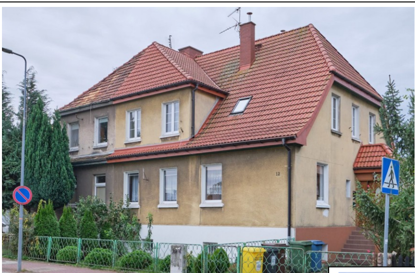
Widok ogólny od północy

7. Fotografia z opisem wskazującym orientację albo mapa z zaznaczonym stanowiskiem archeologicznym