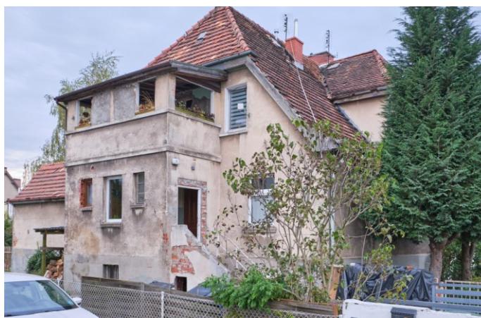
Elewacja południowa z gankiem i aneksem