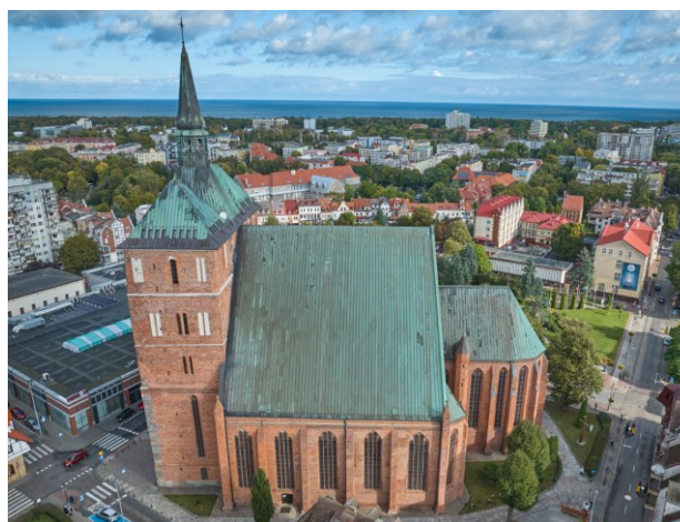
Widok ogólny bryły z lotu ptaka od południa