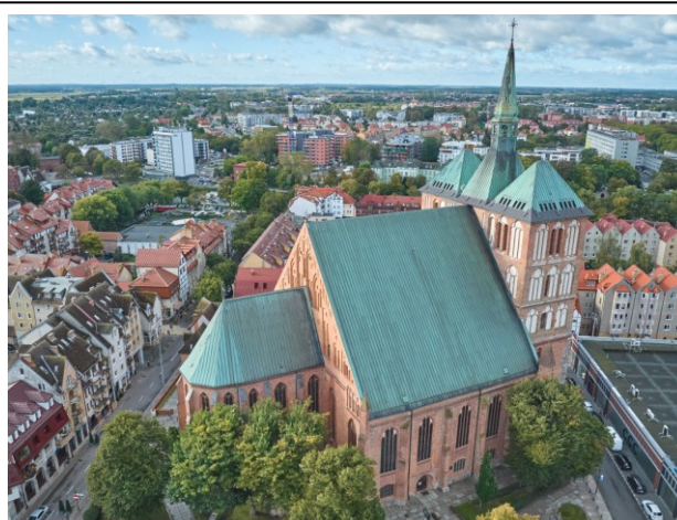
Widok ogólny bryły z lotu ptaka od północnego wschodu