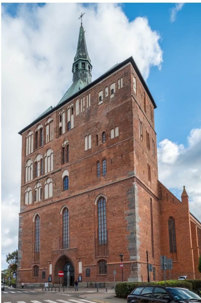
Widok na masyw zachodni świątyni

7. Fotografia z opisem wskazującym orientację albo mapa z zaznaczonym stanowiskiem archeologicznym