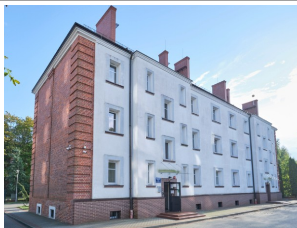
Widok ogólny od północy (od podwórza)