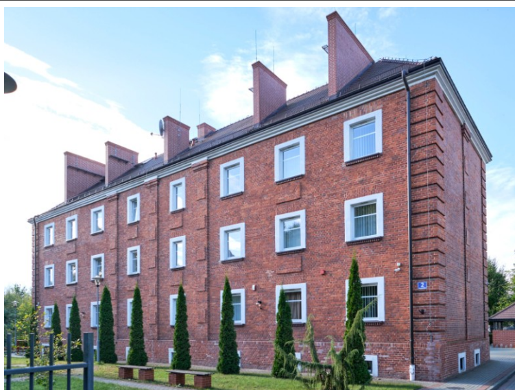
Widok ogólny od wschodu (z ul. Mazowieckiej)

7. Fotografia z opisem wskazującym orientację albo mapa z zaznaczonym stanowiskiem archeologicznym