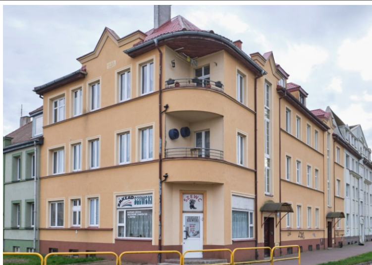
Widok ogólny od północy

7. Fotografia z opisem wskazującym orientację albo mapa z zaznaczonym stanowiskiem archeologicznym