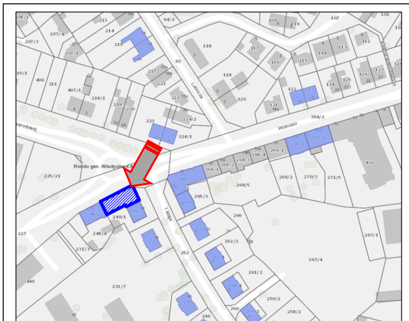
Kołobrzeg, ul. Mazowiecka 40-41 – kamienica - https://mapy.gis.kolobrzeg.pl