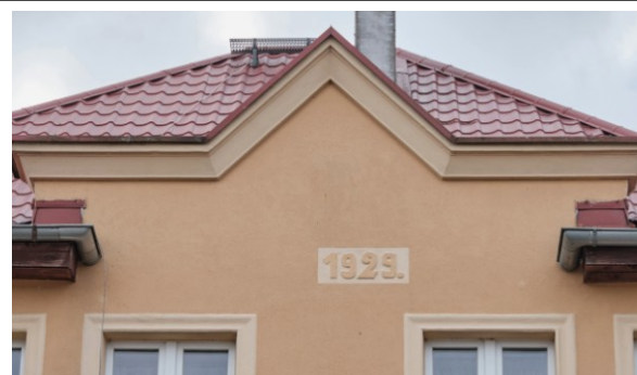
Datownik i gzyms w ścianie półn.-wschodniej