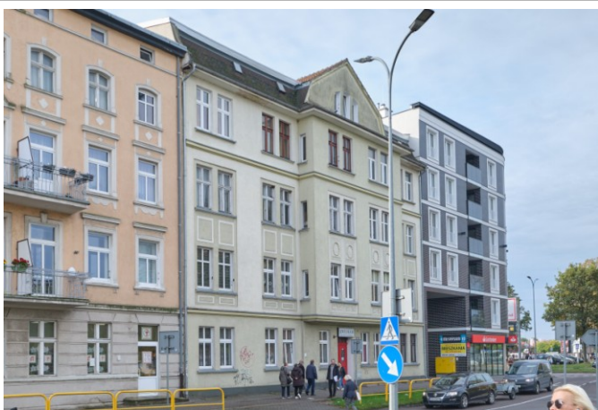
Widok ogólny bryły od strony północno-wschodniej

Obiekt ujęty w Gminnej Ewidencji Zabytków na podstawie Zarządzenia Nr 87/14 Prezydenta Miasta Kołobrzeg z dn. 21.10.2014 r. (aktualizacja: zarządzenie nr 101/22 z dn. 26.08.2022 r.)