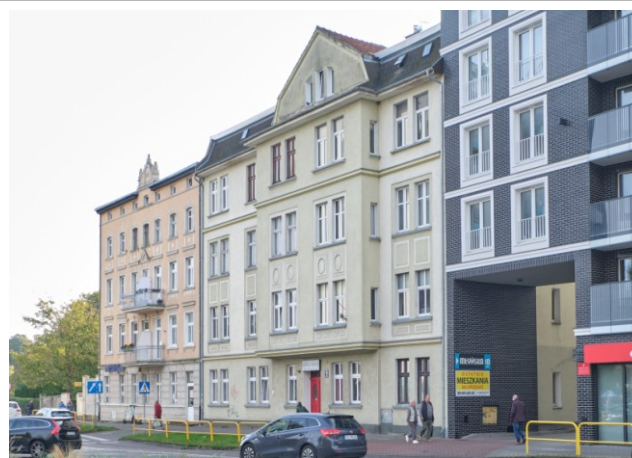
Widok na elewację frontową północno-zachodniej