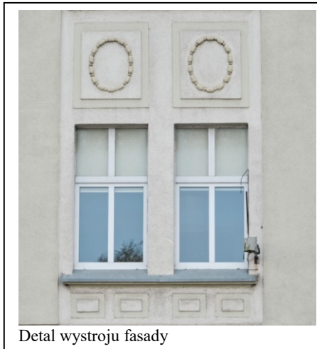
Detal wystroju fasady