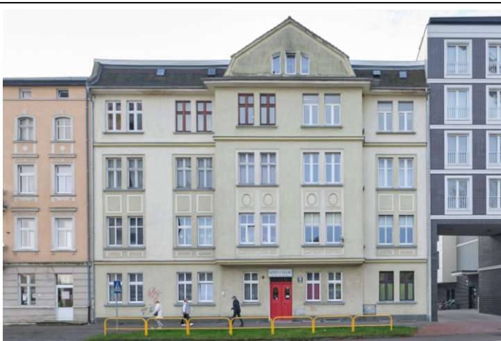
Widok ogólny bryły od strony północno-zachodniej

7. Fotografia z opisem wskazującym orientację albo mapa z zaznaczonym stanowiskiem archeologicznym