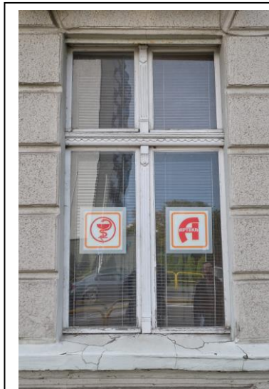
Fasada, oryginalna stolarka okienna