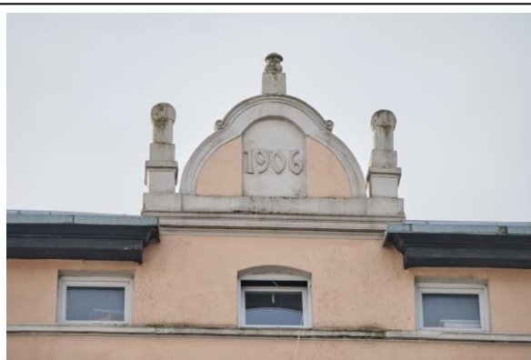
Fasada, szczyt wieńczący