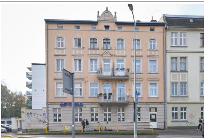
Widok ogólny bryły od strony północnej

7. Fotografia z opisem wskazującym orientację albo mapa z zaznaczonym stanowiskiem archeologicznym