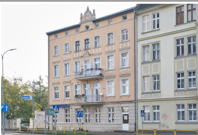
Widok ogólny bryły od strony północno-zachodniej