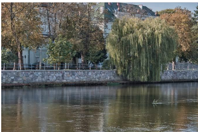
Południowo-zachodnie nabrzeże Parsęty

7. Fotografia z opisem wskazującym orientację albo mapa z zaznaczonym stanowiskiem archeologicznym