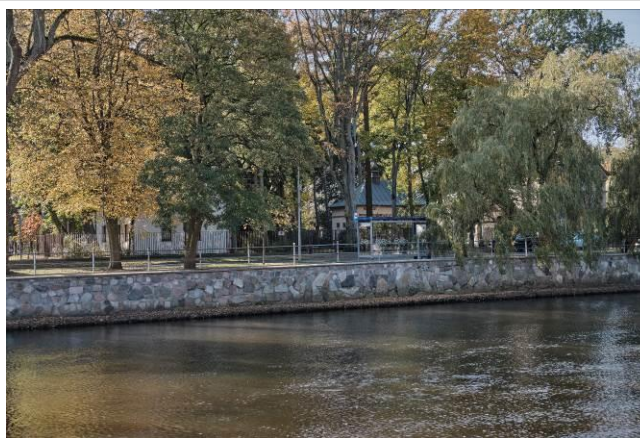
Środkowa część nabrzeża południowo zachodniego