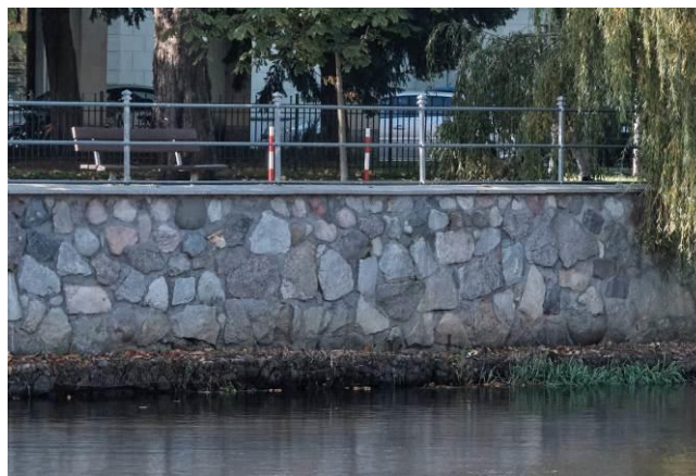
Południowo-zachodnie nabrzeże Parsęty - zbliżenie