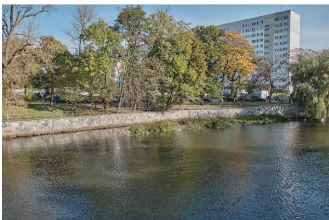
Północna część nabrzeża północno-wschodniego Parsęty