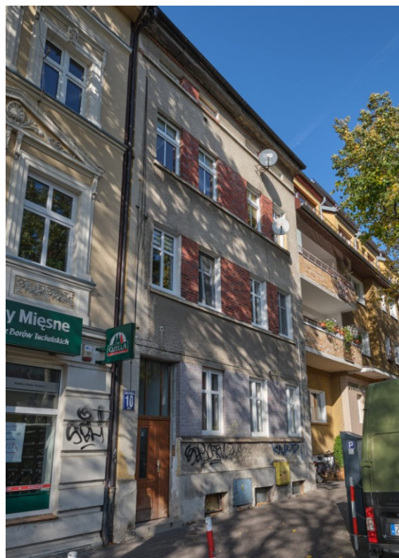
Widok fasady kamienicy od strony południowo-wschodniej