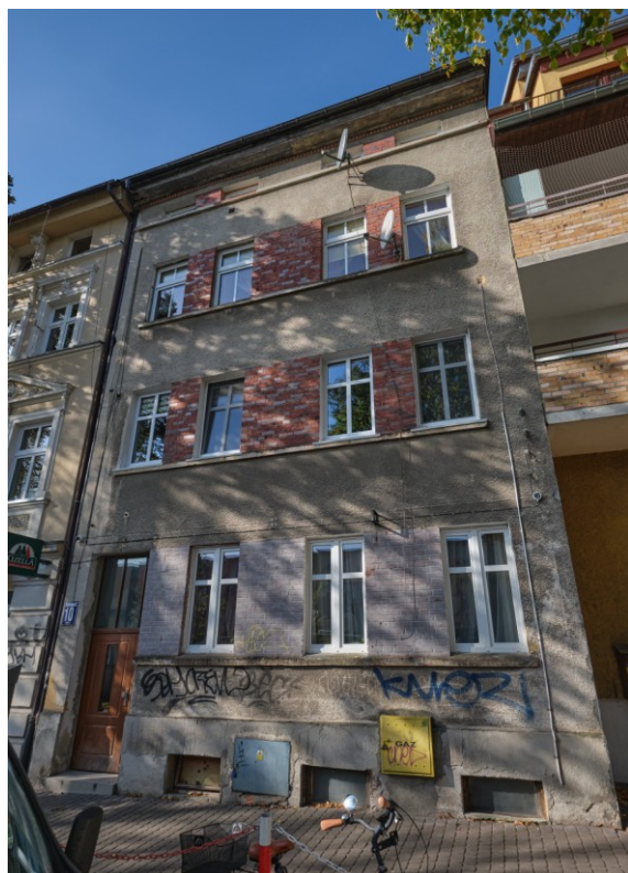
Widok fasady kamienicy od strony północno-wschodniej

Obiekt ujęty w Gminnej Ewidencji Zabytków na podstawie Zarządzenia Nr 87/14 Prezydenta Miasta Kołobrzeg z dn. 21.10.2014 r. (aktualizacja: zarządzenie nr 101/22 z dn. 26.08.2022 r.)