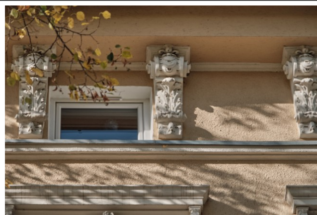
Fasada, fragment, detale wystroju architektonicznego