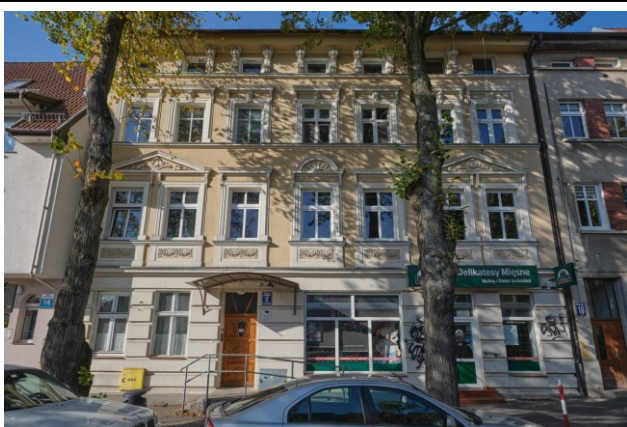
Widok fasady kamienicy od strony południowo-wschodniej

7. Fotografia z opisem wskazującym orientację albo mapa z zaznaczonym stanowiskiem archeologicznym