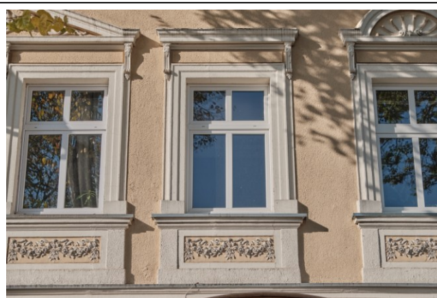
Fasada, fragment, detale wystroju architektonicznego