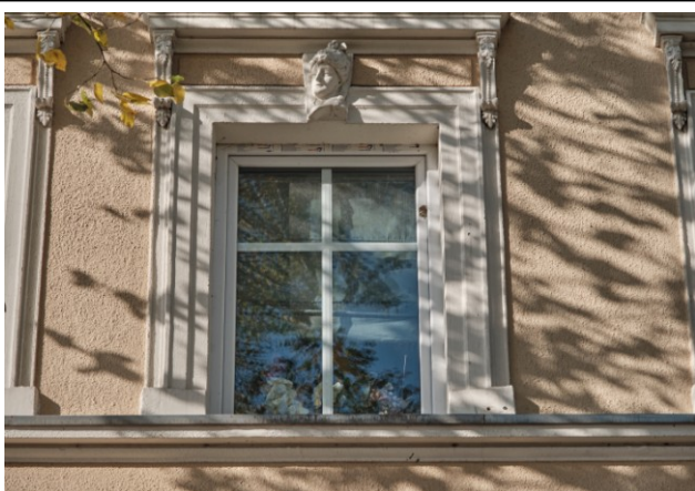
Fasada, fragment, obramienie jednego z okien