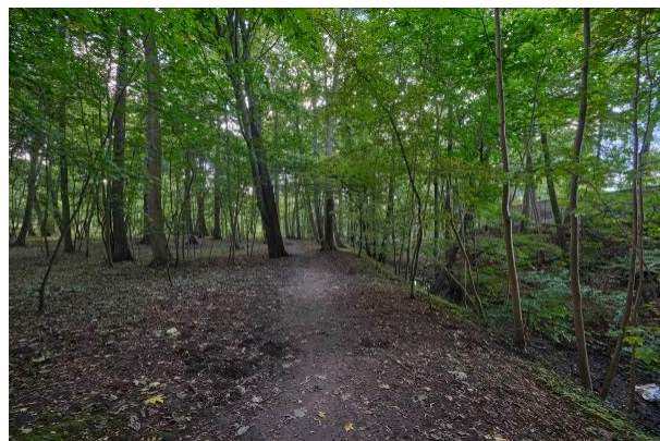
Fragm. parku przy amfiteatrze

Obiekt ujęty w Gminnej Ewidencji Zabytków na podstawie Zarządzenia Nr 101/22 Prezydenta Miasta Kołobrzeg, z dn. 26.08.2022 r.