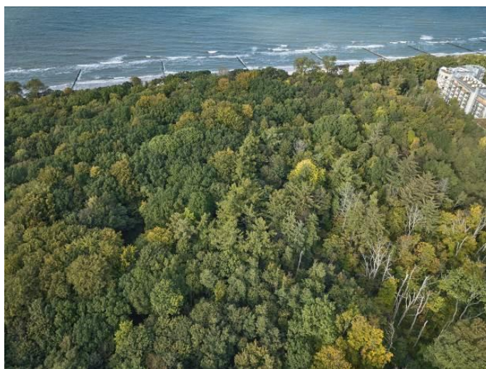
Widok z lotu ptaka na część półn. parku