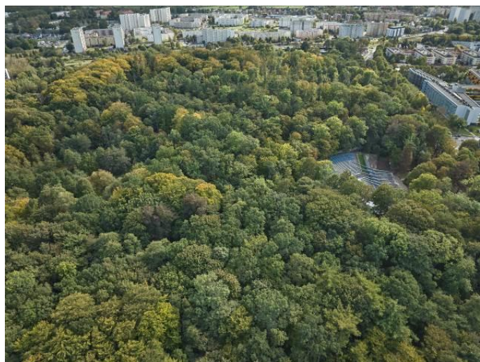
Widok z lotu ptaka na część płd. parku

7. Fotografia z opisem wskazującym orientację albo mapa z zaznaczonym stanowiskiem archeologicznym