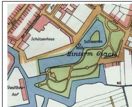
Teren parku w 1906 r.