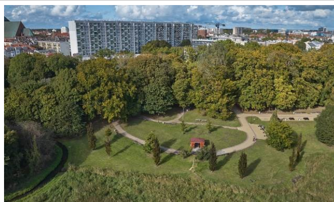
Nowa, płd.-zach. część parku