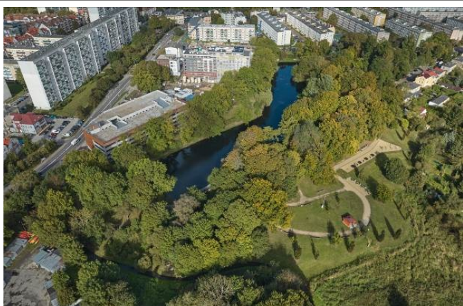
Widok ogólny z lotu ptaka od płd.-zach.

7. Fotografia z opisem wskazującym orientację albo mapa z zaznaczonym stanowiskiem archeologicznym