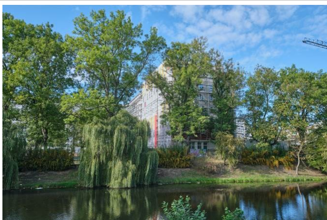
Widok zach. części parku