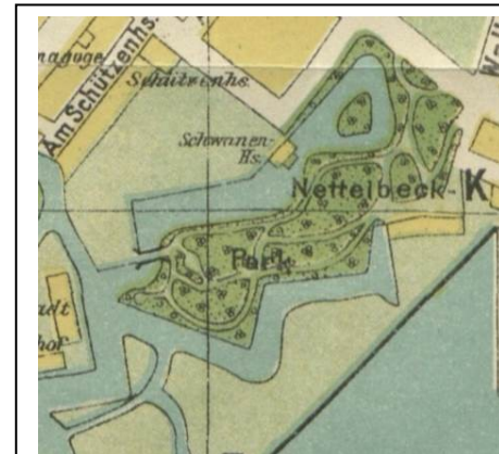
Park Nettelbecka w 1914 r.