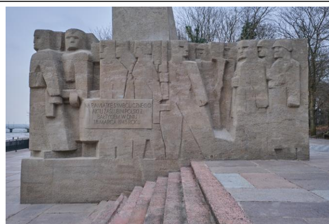
Widok detalu, od strony zachodniej