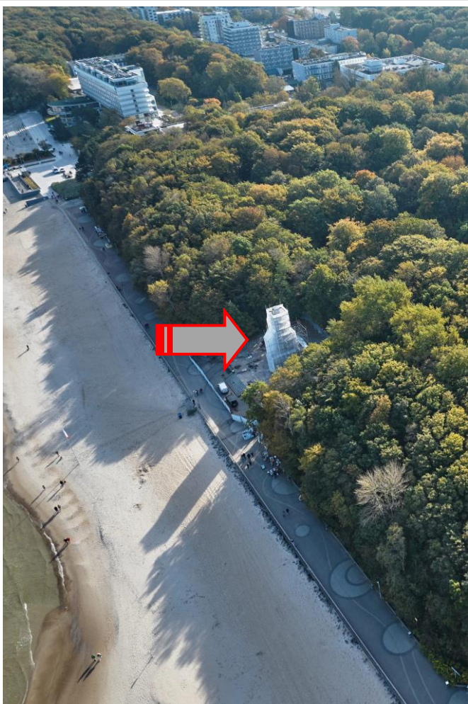
Widok ogólny z lotu ptaka od strony od północnego zachodu

7. Fotografia z opisem wskazującym orientację albo mapa z zaznaczonym stanowiskiem archeologicznym