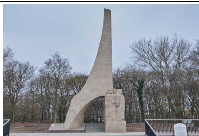
Widok frontowy, od strony plaży nadmorskiej