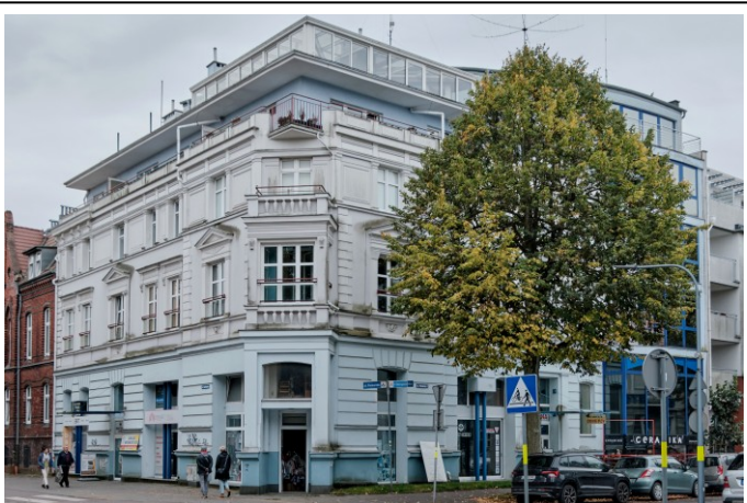
Widok ogólny bryły od strony północno-zachodniej

7. Fotografia z opisem wskazującym orientację albo mapa z zaznaczonym stanowiskiem archeologicznym