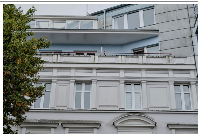
Widok na górną część fasady zachodniej od strony ul. Pomorskiej