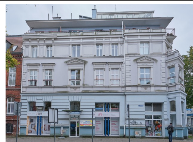
Widok na fasadę północną od strony ul. Zwycięzców