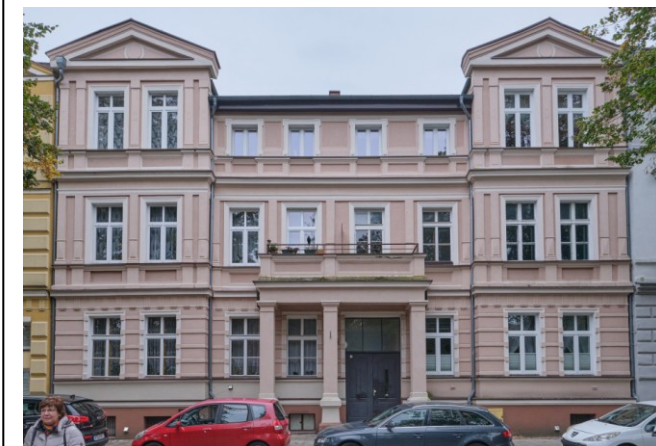
Widok na elewację frontową zachodnią