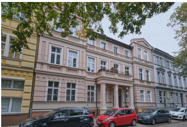
Widok ogólny kamienicy od strony północnej

7. Fotografia z opisem wskazującym orientację albo mapa z zaznaczonym stanowiskiem archeologicznym