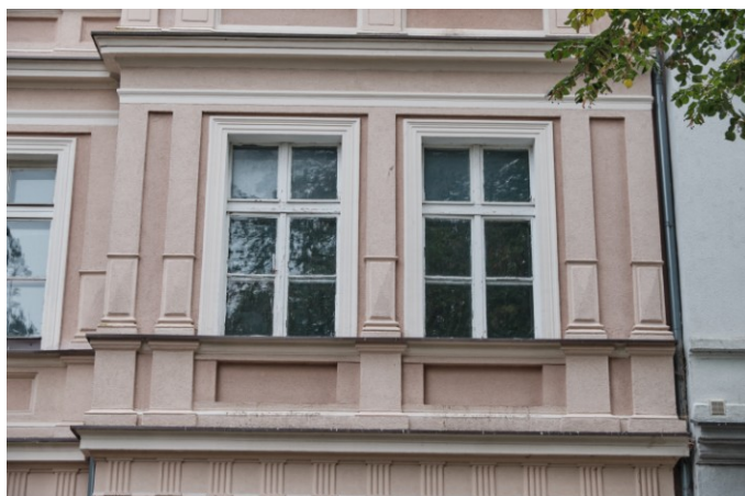
Elewacja frontowa, fragmenty wystroju architektonicznego