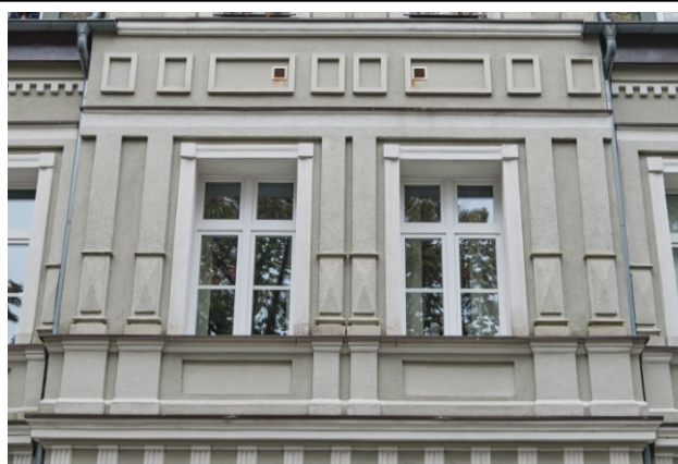
Detale dekoracji tynkarskiej fasady