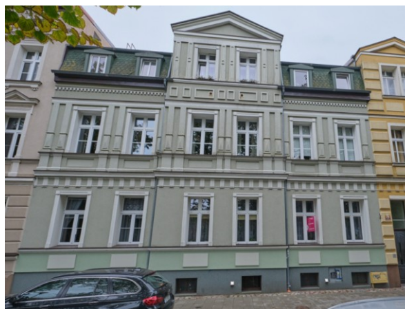
Elewacja frontowa (zachodnia) kamienicy