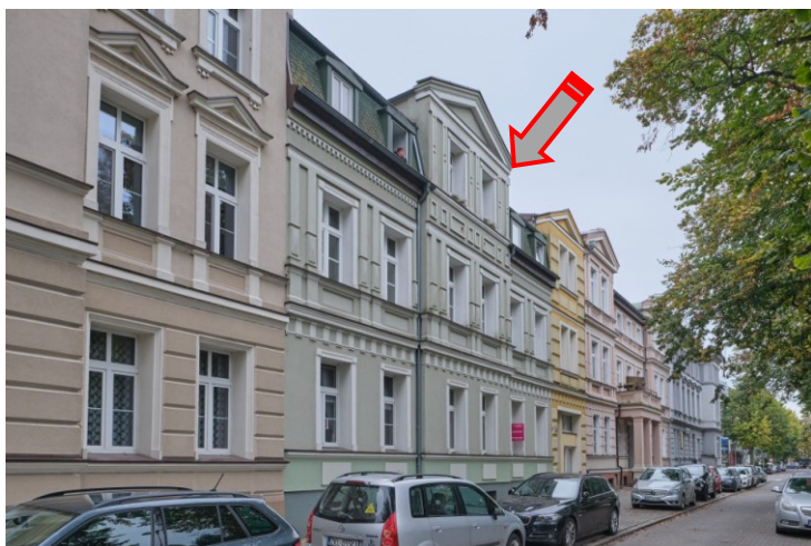
Widok ogólny kamienicy od strony północnej

7. Fotografia z opisem wskazującym orientację albo mapa z zaznaczonym stanowiskiem archeologicznym