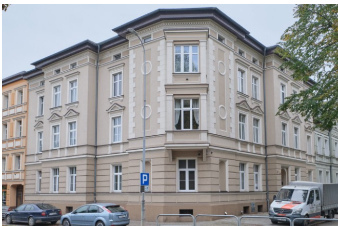
Widok ogólny kamienicy od strony północnej

7. Fotografia z opisem wskazującym orientację albo mapa z zaznaczonym stanowiskiem archeologicznym