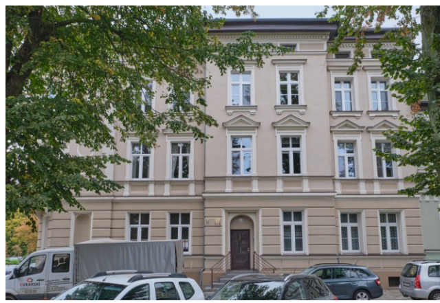
Widok na elewację frontową zachodnią (od strony ul. Pomorskiej)