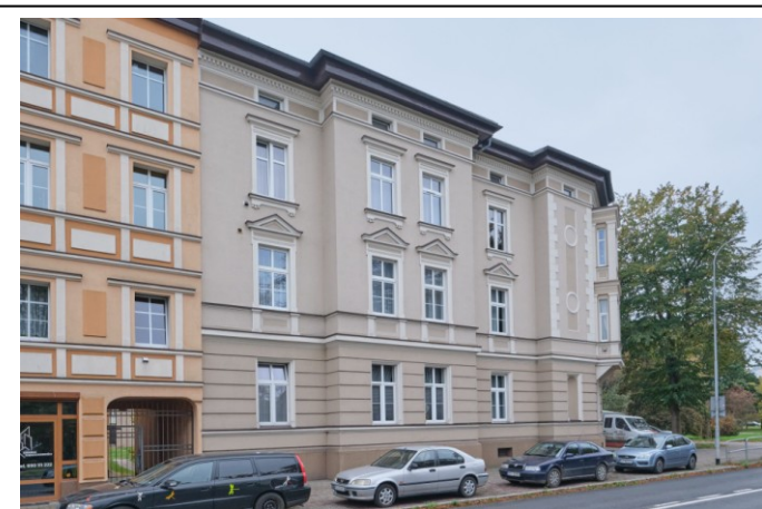
Widok na elewację frontową północną (od strony ul. Jagiellońskiej)