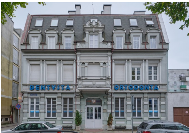
Widok na elewację frontową wschodnią