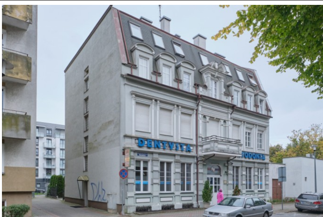
Widok ogólny bryły od strony południowo-wschodniej

7. Fotografia z opisem wskazującym orientację albo mapa z zaznaczonym stanowiskiem archeologicznym