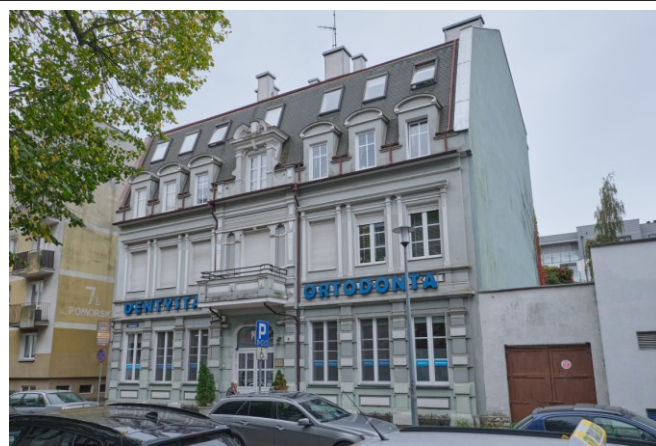
Widok ogólny bryły od strony północno-wschodniej