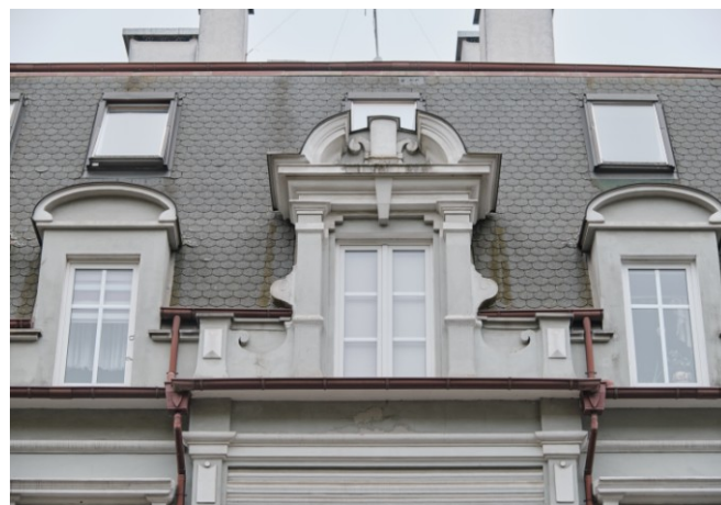
Elewacja frontowa, wystawka dachowa