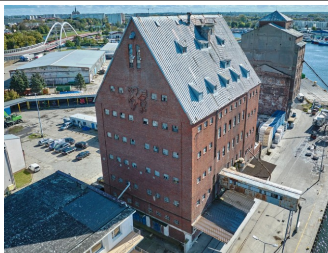
Widok ogólny z lotu ptaka od strony północno zachodniej