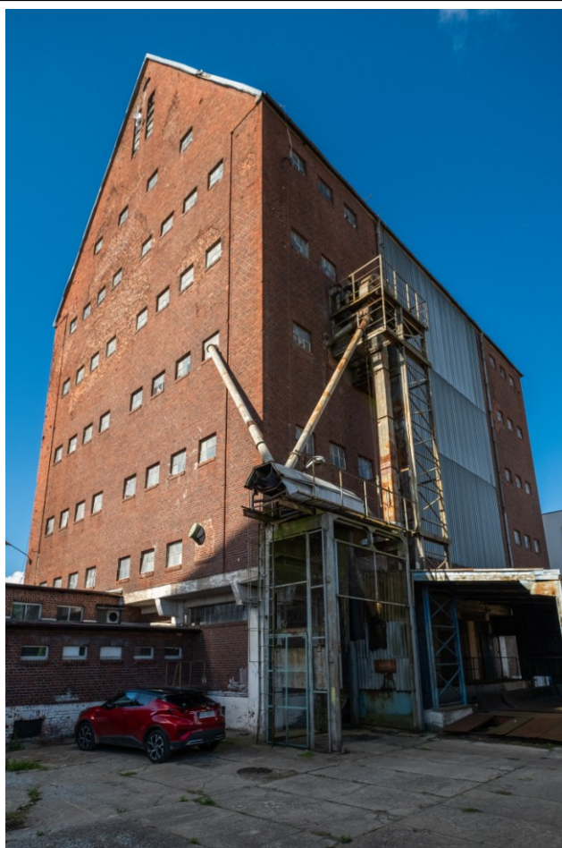
Widok ogólny bryły od strony południowo-wschodniej

7. Fotografia z opisem wskazującym orientację albo mapa z zaznaczonym stanowiskiem archeologicznym