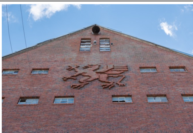
Szczyt ściany północnej z emblematem Gryfa Pomorskiego