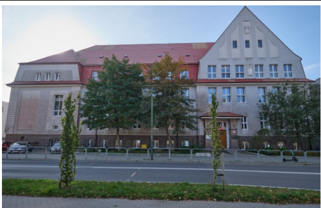
Widok elewacji frontowej od strony północnej