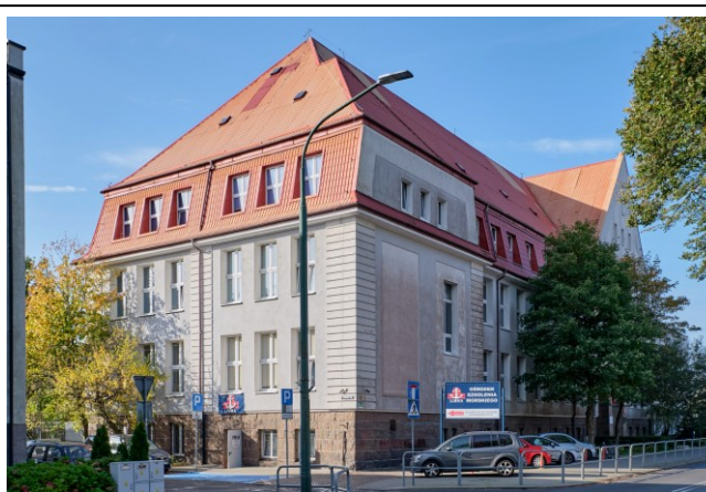
Widok ogólny bryły od strony północno-wschodniej