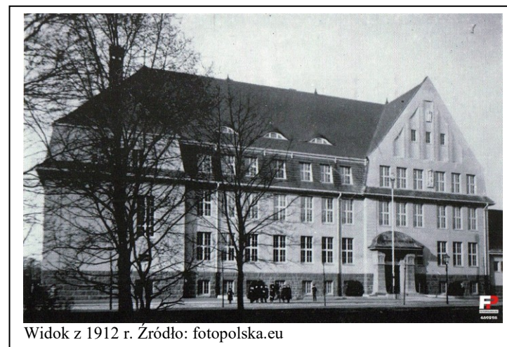
Widok z 1912 r.

- wszelkie prace budowlano-konserwatorskie winny być uzgadniane z MKZ w Kołobrzegu. Obowiązuje zachowanie: historycznej bryły, kompozycji i podziałów elewacji frontowej wraz z detalami wystroju architektonicznego, oryginalnych stolarek (okiennych, drzwiowych, balustrad schodów); w przypadku zniszczenia historycznej formy, przy wymianie wskazane jest odtworzenie pierwotnego kształtu i podziałów.