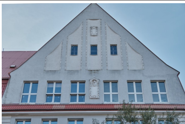
Szczyt wieńczący ryzalit frontowy (zachodni)