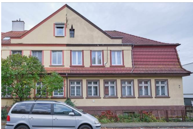
Elewacja frontowa, północno-wschodnia

7. Fotografia z opisem wskazującym orientację albo mapa z zaznaczonym stanowiskiem archeologicznym