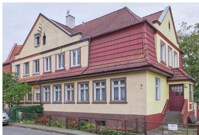
Widok ogólny bryły od strony północnej