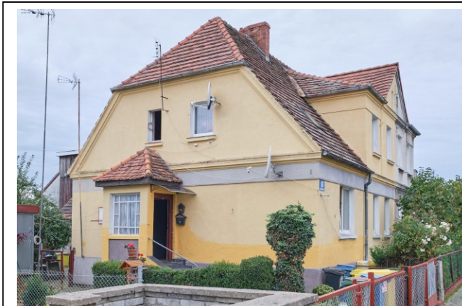
Widok ogólny bryły od strony wschodniej