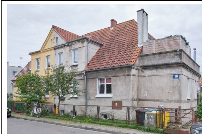
Widok ogólny bryły od strony północnej