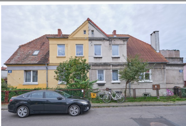
Elewacja frontowa, północno-wschodnia

7. Fotografia z opisem wskazującym orientację albo mapa z zaznaczonym stanowiskiem archeologicznym