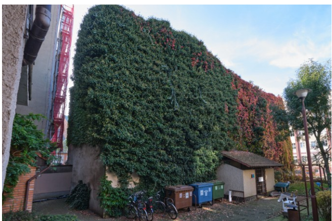
Widok ogólny bryły od strony wschodniej

7. Fotografia z opisem wskazującym orientację albo mapa z zaznaczonym stanowiskiem archeologicznym