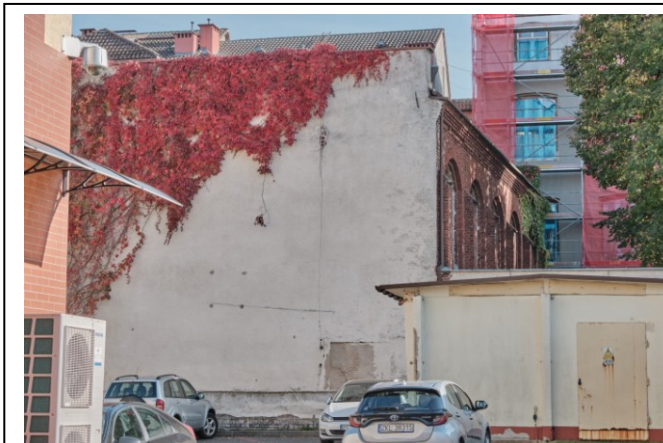
Widok ogólny bryły od strony zachodniej