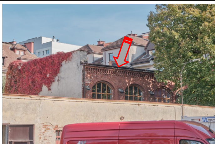
Widok na elewację południową