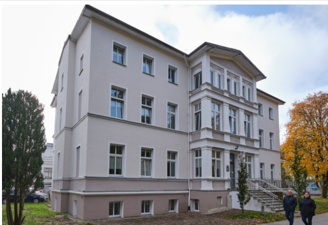
Widok ogólny bryły od strony północno-wschodniej

7. Fotografia z opisem wskazującym orientację albo mapa z zaznaczonym stanowiskiem archeologicznym