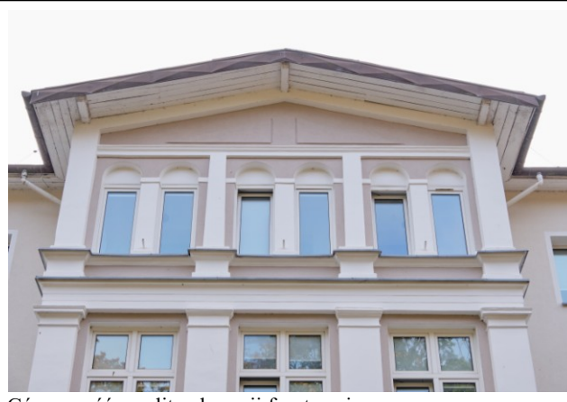
Górna część ryzalitu elewacji frontowej