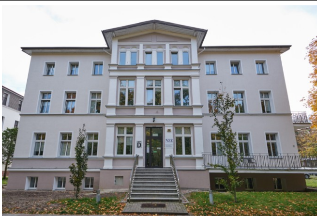
Widok elewacji frontowej północnej