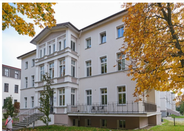
Widok ogólny bryły od strony północno-zachodniej