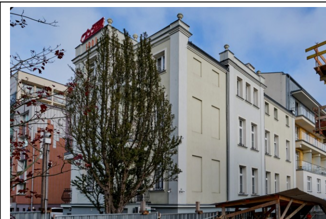
Widok ogólny bryły od strony południowo-zachodniej