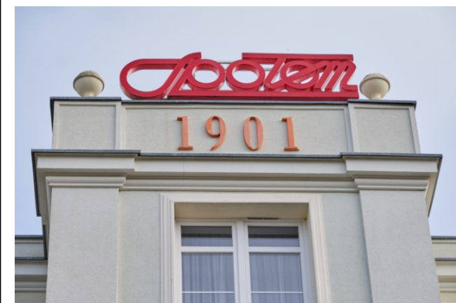
Zwieńczenie ryzalitu środkowego elewacji frontowej