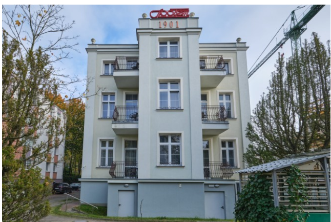
Widok elewacji frontowej, zachodniej