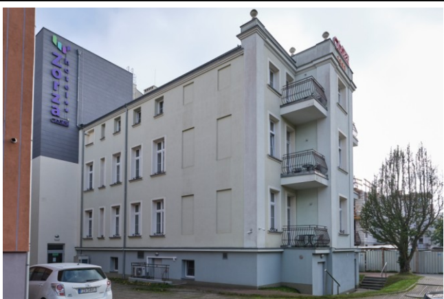
Widok ogólny bryły od strony północno-zachodniej

7. Fotografia z opisem wskazującym orientację albo mapa z zaznaczonym stanowiskiem archeologicznym