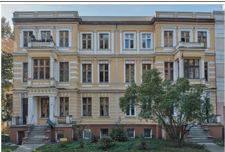
Elewacja frontowa, północno-wschodnia

7. Fotografia z opisem wskazującym orientację albo mapa z zaznaczonym stanowiskiem archeologicznym