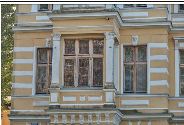
Ryzalit wschodni – I piętro