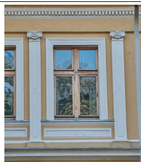
Okno II piętra głównego korpusu budynku