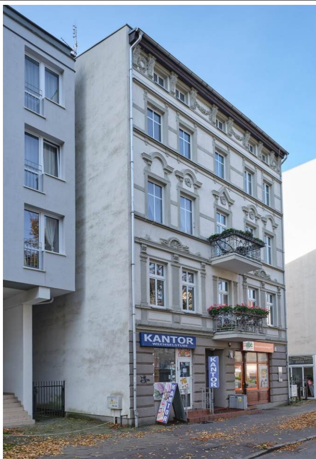
Elewacja frontowa – widok od strony wschodniej

7. Fotografia z opisem wskazującym orientację albo mapa z zaznaczonym stanowiskiem archeologicznym