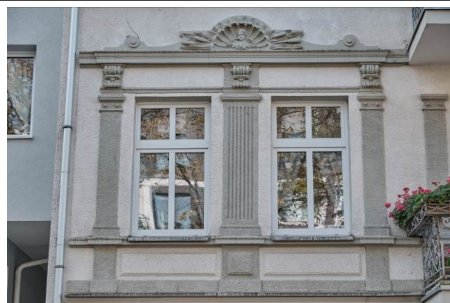
Widok ogólny bryły od strony południowo-wschodniej