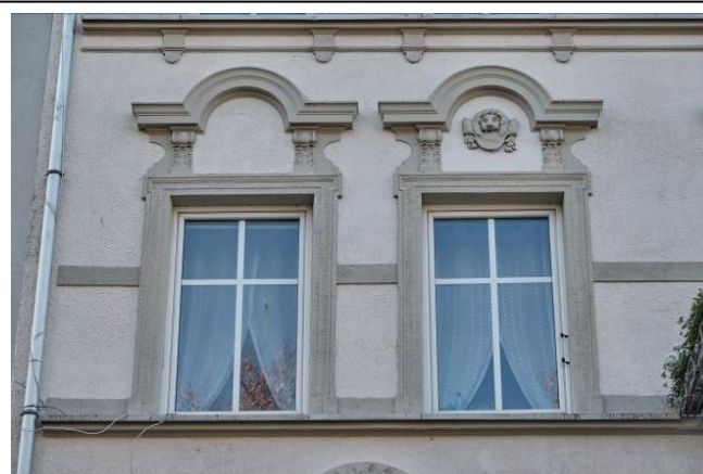
Widok ogólny bryły od strony zachodniej