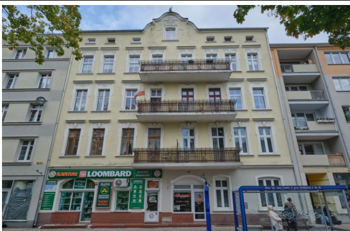
Widok ogólny fasady kamienicy od strony południowej

7. Fotografia z opisem wskazującym orientację albo mapa z zaznaczonym stanowiskiem archeologicznym