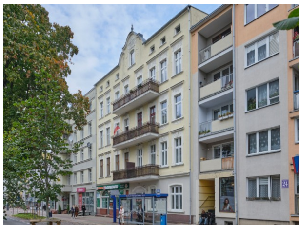
Widok ogólny bryły od strony południowo-wschodniej