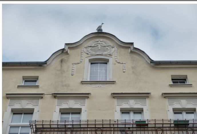
Fasada (elewacja południowa), szczyt wieńczący