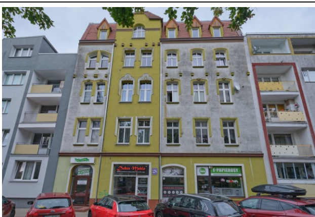
Widok fasady kamienicy od strony południowej

7. Fotografia z opisem wskazującym orientację albo mapa z zaznaczonym stanowiskiem archeologicznym