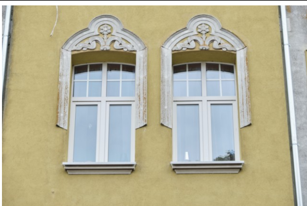
Fragment fasady, tynkarskie oprawy okien