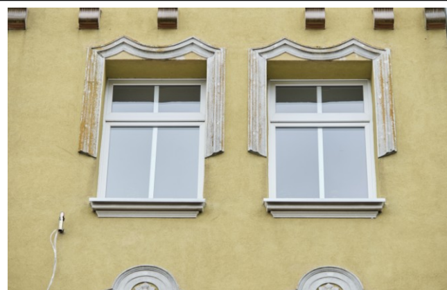
Fragment fasady, tynkarskie oprawy okien