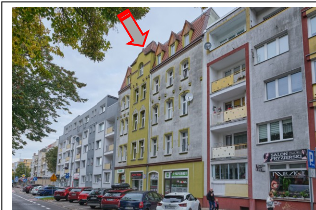
Widok ogólny bryły od strony południowo-wschodniej