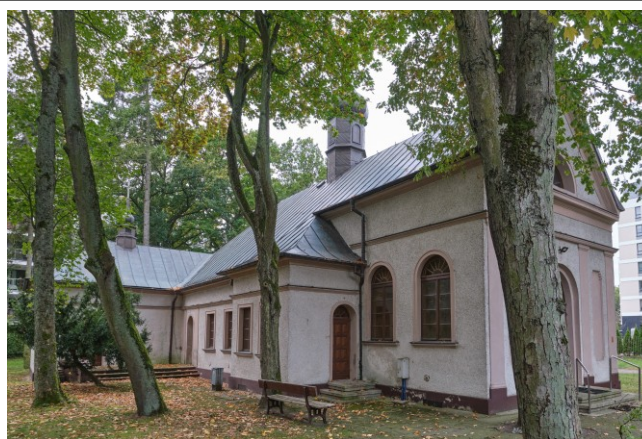
Detal okna i gzymsu wieńczącego