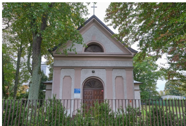
Widok ogólny bryły od strony południowej