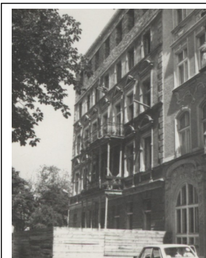
Kamienica nr 6 - widok z 1985 r.

historycznej bryły, kompozycji i podziałów elewacji frontowej wraz z detalami wystroju architektonicznego, oryginalnych stolarek (okiennych, drzwiowych, balustrad schodów); w przypadku zniszczenia historycznej formy, przy wymianie wskazane odtworzenie pierwotnego kształtu i podziałów.