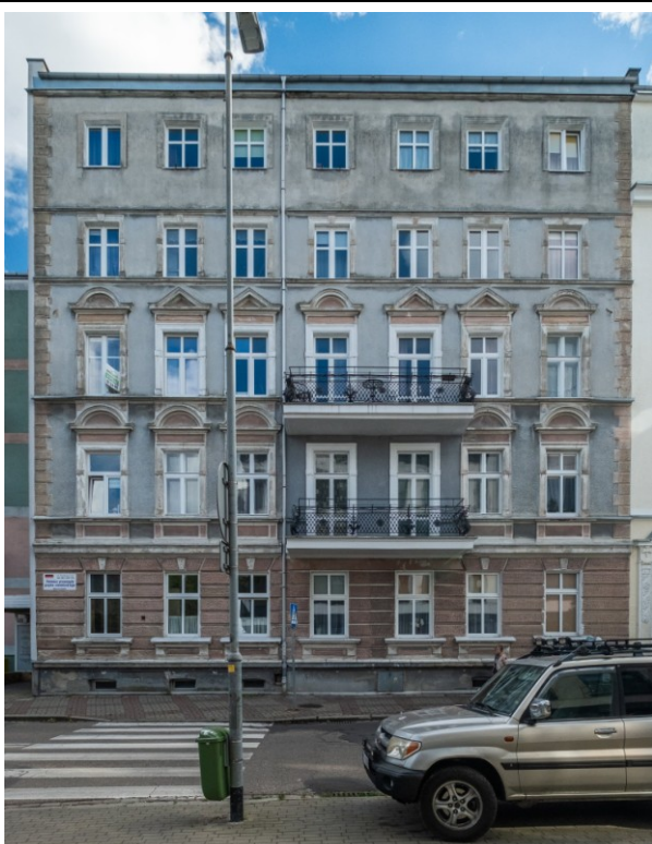
Fasada (elewacja zachodnia) kamienicy

7. Fotografia z opisem wskazującym orientację albo mapa z zaznaczonym stanowiskiem archeologicznym