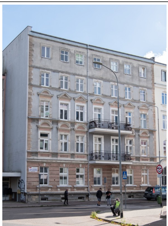
Widok bryły od strony północno zachodniej