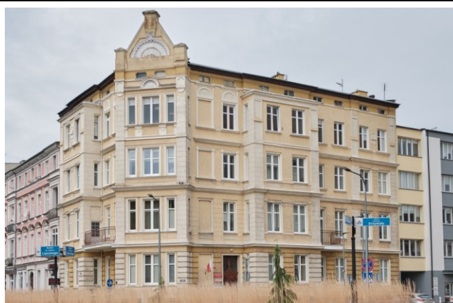
Widok ogólny bryły od strony wschodniej