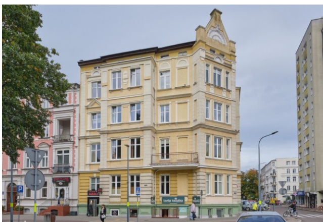
Widok ogólny bryły od strony południowej