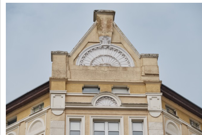
Zwieńczenie części narożnej