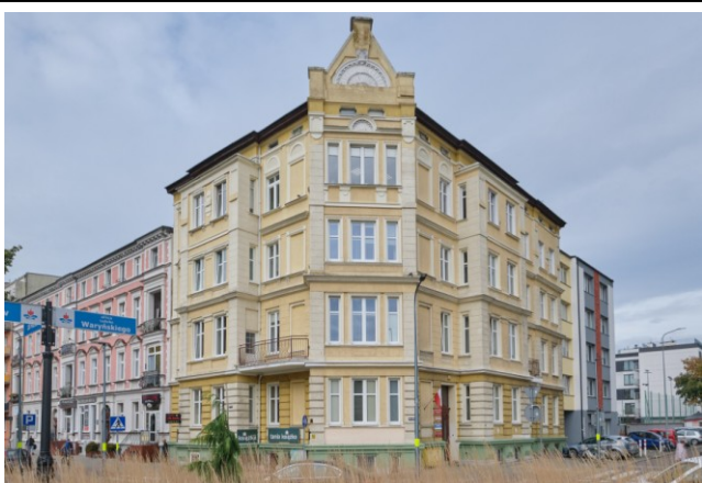
Widok ogólny bryły od strony południowo-wschodniej

7. Fotografia z opisem wskazującym orientację albo mapa z zaznaczonym stanowiskiem archeologicznym