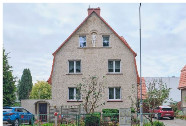
Widok elewacji północnej