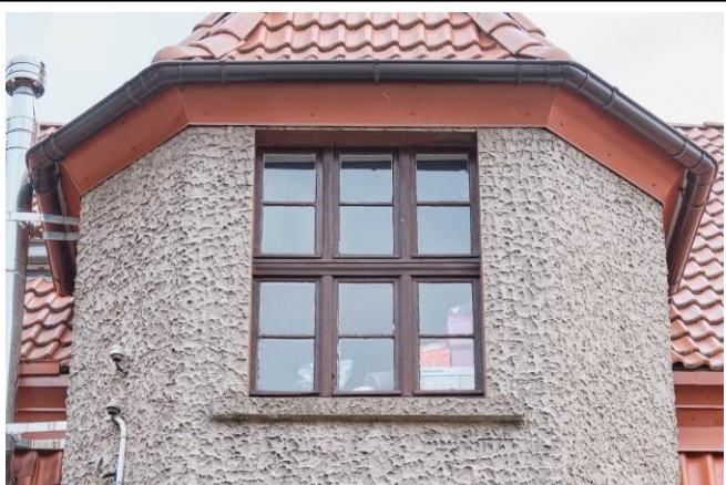
Zachowana oryginalna stolarka okienna w elewacji zachodniej