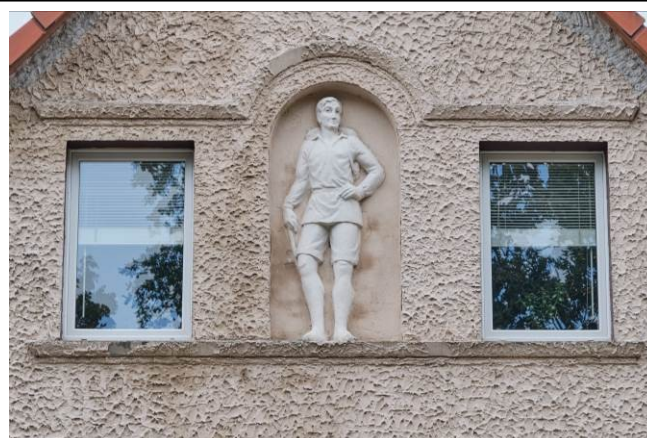
Rzeźba „wędrowca” w szczycie elewacji północnej