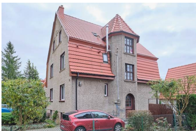
Widok ogólny bryły od strony północno-zachodniej

7. Fotografia z opisem wskazującym orientację albo mapa z zaznaczonym stanowiskiem archeologicznym