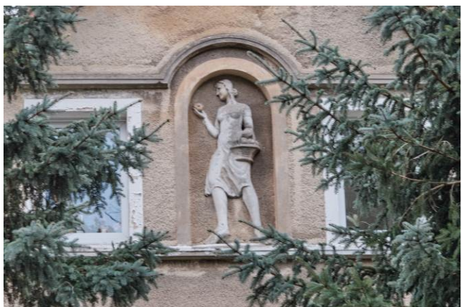
Rzeźba „kobiety z koszem owoców” w szczycie elewacji północnej