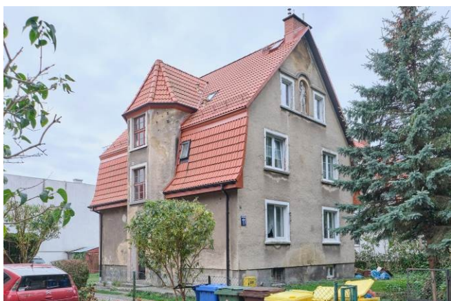
Widok ogólny bryły od strony północno-wschodniej

7. Fotografia z opisem wskazującym orientację albo mapa z zaznaczonym stanowiskiem archeologicznym