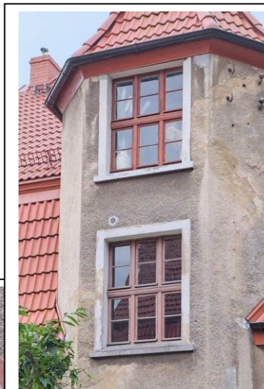
Zachowana oryginalna stolarka okienna w elewacji wschodniej