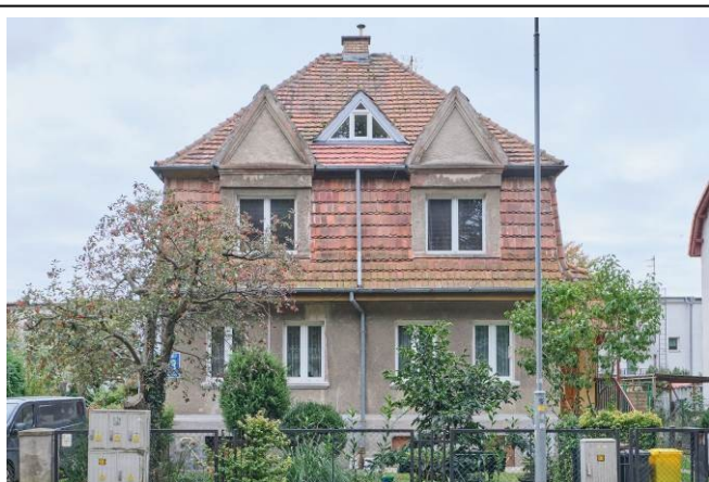
Frontowa elewacja północna