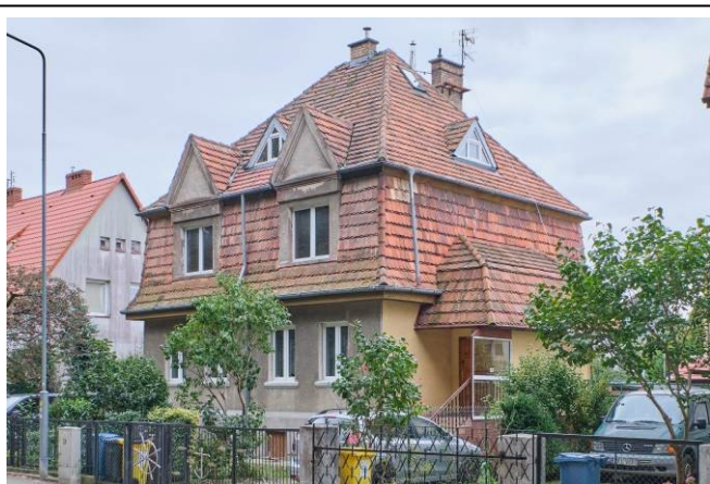
Widok ogólny bryły od strony północno-zachodniej

7. Fotografia z opisem wskazującym orientację albo mapa z zaznaczonym stanowiskiem archeologicznym