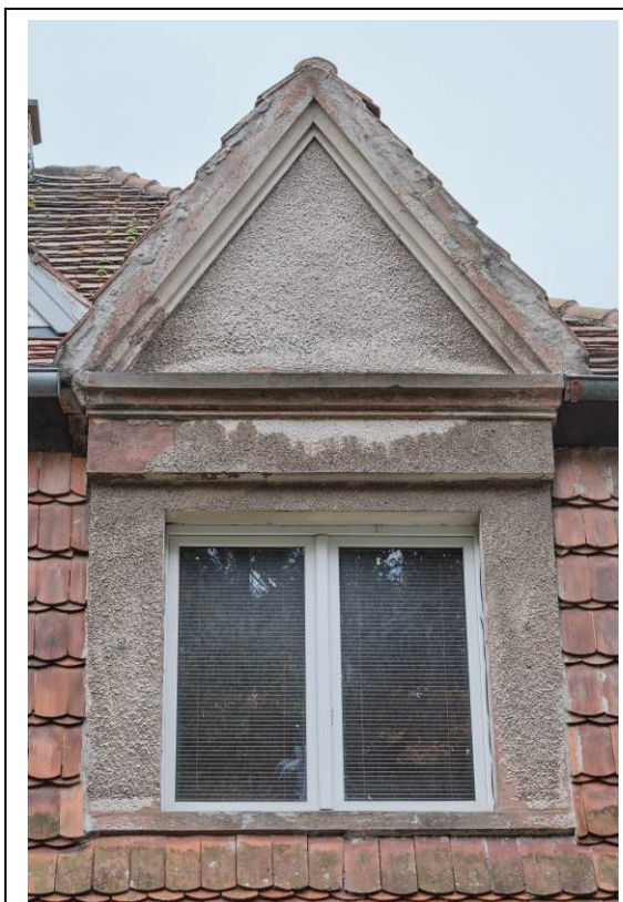
Lukarna ze szczytem trójkątnym