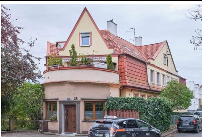
Szczyt budynku od strony wschodniej