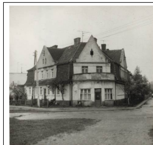
Ul. Wolności 26 - widok z 1986 r.

Ochrona w zakresie zachowania: bryły budynku, wystroju architektonicznego elewacji oraz kształtu i rozmieszczenia okien.