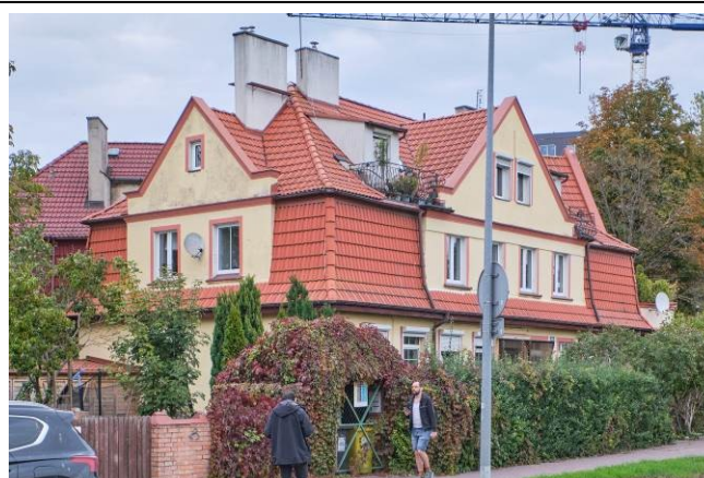
Widok ogólny bryły od strony południowo-zachodniej