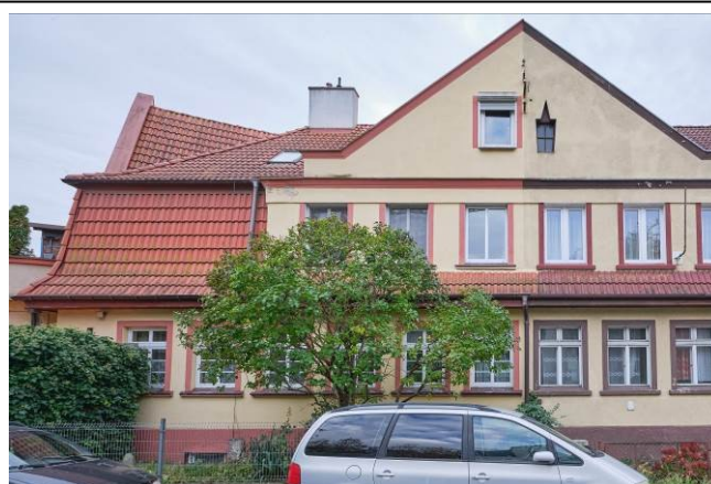
Elewacja pn.-wsch. – od strony ulicy Radomskiej