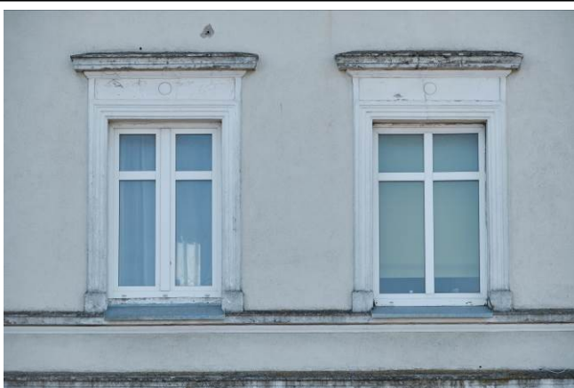
Detal architektoniczny – okna I piętra