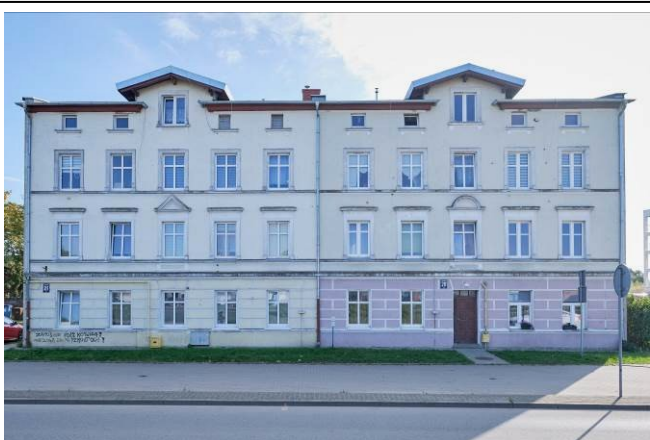
Elewacja frontowa – północno-zachodnia

7. Fotografia z opisem wskazującym orientację albo mapa z zaznaczonym stanowiskiem archeologicznym