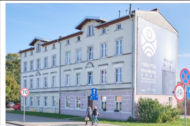
Widok ogólny bryły od strony zachodniej