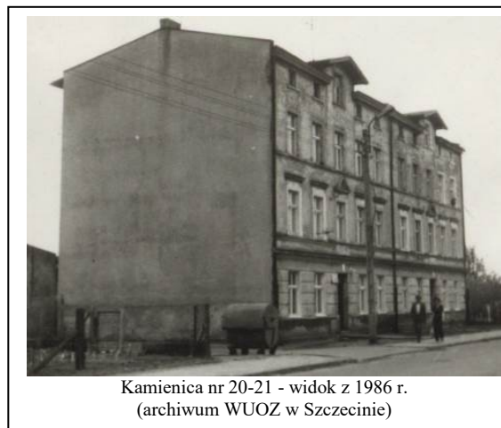
Kamienica nr 20-21 - widok z 1986 r.

Ochrona w zakresie zachowania: bryły budynku, wystroju architektonicznego elewacji oraz kształtu i rozmieszczenia okien.