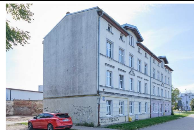
Widok ogólny bryły od strony północnej