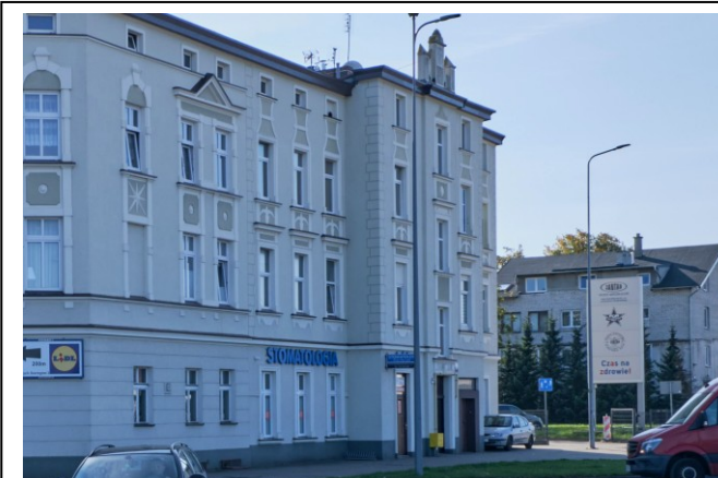
Widok ogólny bryły od strony północnej