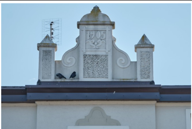
Detal architektoniczny – datownik