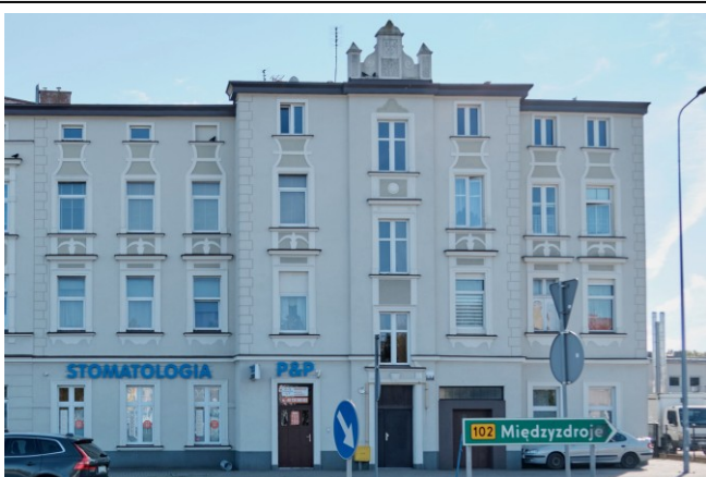
Elewacja frontowa – północno-zachodnia

7. Fotografia z opisem wskazującym orientację albo mapa z zaznaczonym stanowiskiem archeologicznym