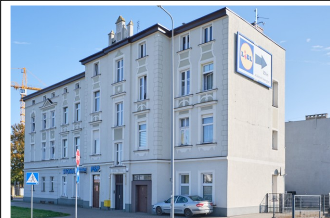
Widok ogólny bryły od strony południowo-zachodniej