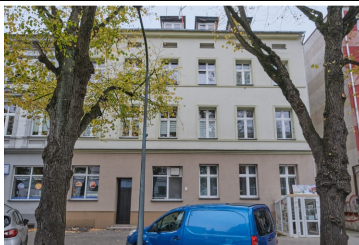
Widok na elewację frontową południową