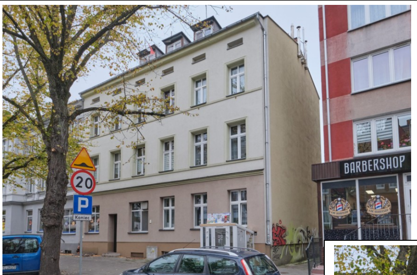
Widok ogólny bryły od strony południowo-wschodniej

7. Fotografia z opisem wskazującym orientację albo mapa z zaznaczonym stanowiskiem archeologicznym