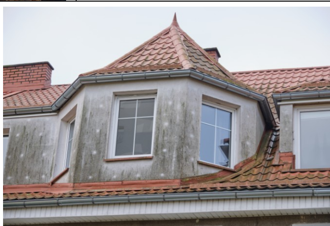
Widok na wystawkę od strony kamienicy nr 37