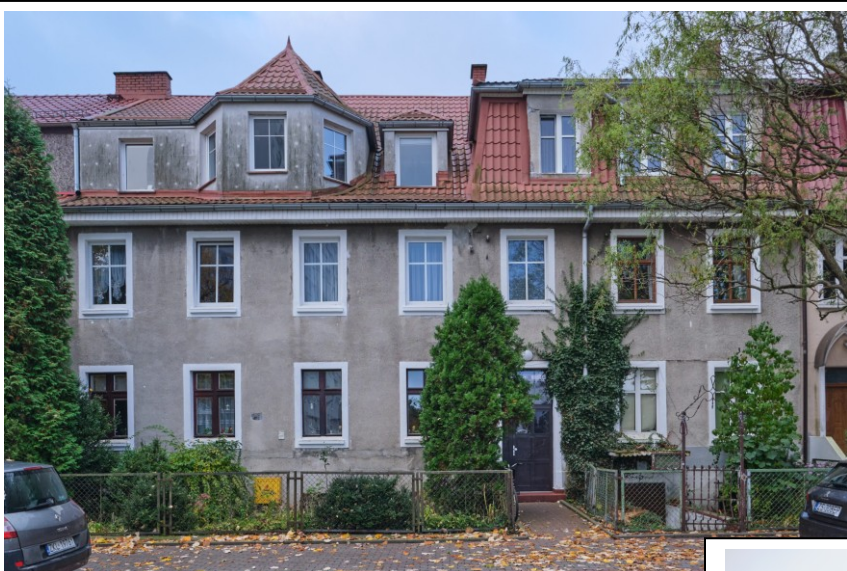
Widok elewacji frontowej od północy

7. Fotografia z opisem wskazującym orientację albo mapa z zaznaczonym stanowiskiem archeologicznym