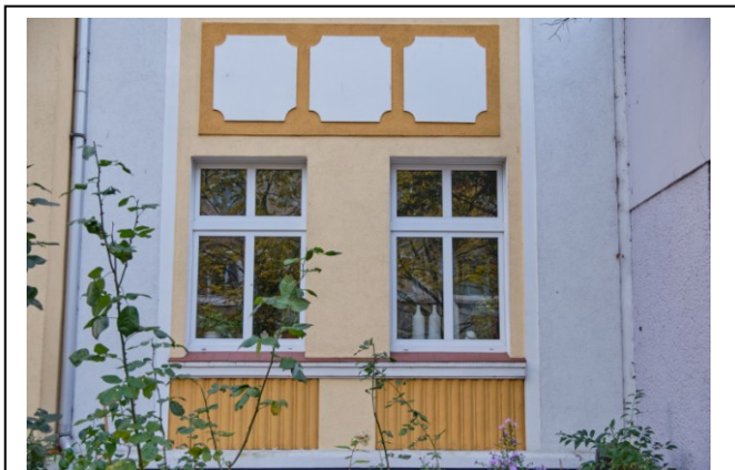
Widok na okna parteru