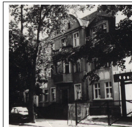
Kamienica nr 41 - widok z 1987 r.