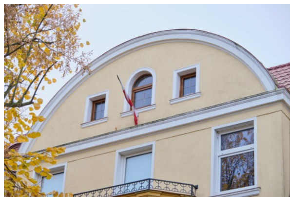
Widok szczytu ryzalitu