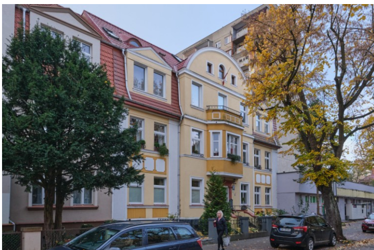
Widok elewacji frontowej od płn.-wsch.

7. Fotografia z opisem wskazującym orientację albo mapa z zaznaczonym stanowiskiem archeologicznym