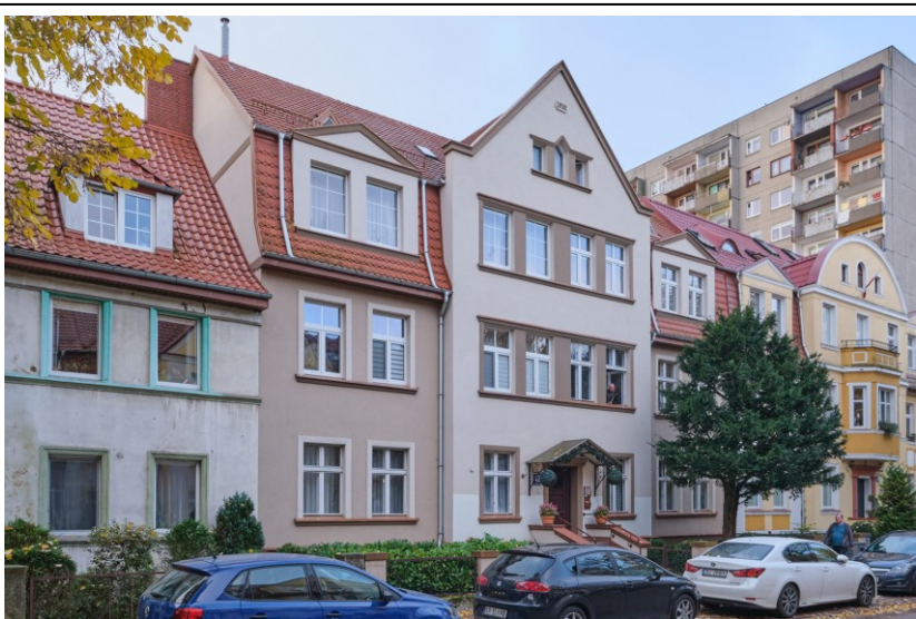
Widok elewacji frontowej od wschodu

7. Fotografia z opisem wskazującym orientację albo mapa z zaznaczonym stanowiskiem archeologicznym