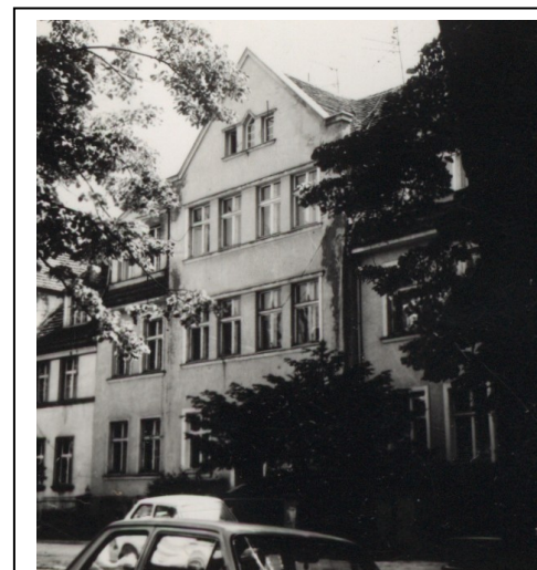
Kamienica nr 42 - widok z 1987 r.