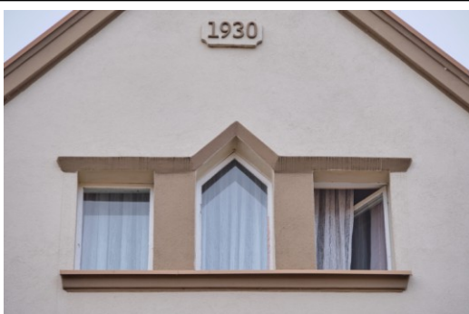
Widok na szczyt ryzalitu z datownikiem „1930”