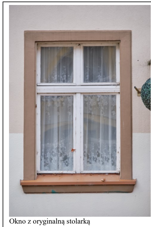
Okno z oryginalną stolarką